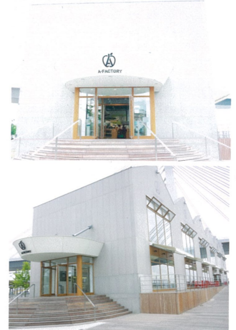
JR東日本が進める「地域再発見プロジェクト」の一環として、青森県ウォーターフロントで、青森県産りんごを各種飲料に加工する「工房」と、青森県産の様々な食材が楽しめる物販・飲食一体型の市場「A-Factory」(※屋内一部施工)