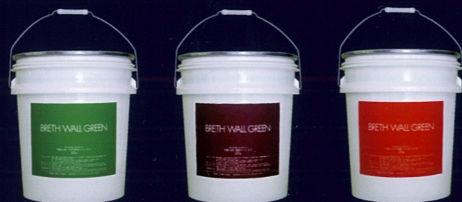
内・外壁上塗り ホタテ漆喰クリーム B・K 内・外壁上塗り 漆喰クリーム B・S 内・外壁下塗り材 ホタテ漆喰クリーム ベース材 B・B

■製造元：株式会社エスパス ■製造元：株式会社エスパス TEL：042-467-2278 Mobile：090-1553-9303